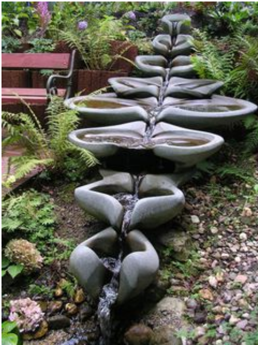
Eine wunderschöne Sevenfold Flowform - Kaskade